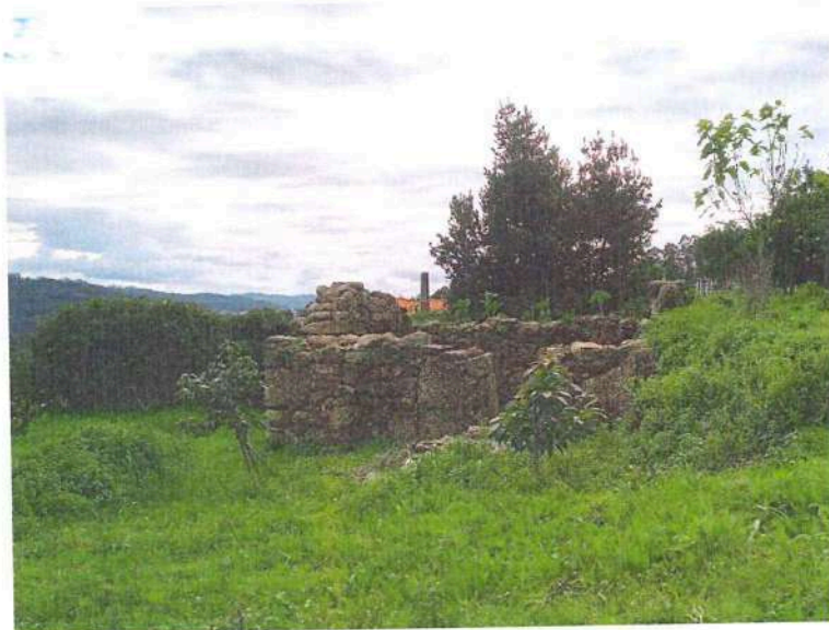
Imagem 2 – Foto da edificação (lateral).