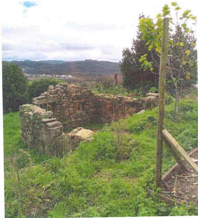
Imagem 1 – Foto da edificação (superior).